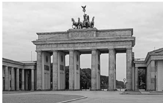
Das Brandenburger Tor in Berlin – Symbol der Einheit.

Nur wenige haben dies vorhergesehen. Überrascht von der Wucht der Ereignisse war nicht nur die Bundesregierung. Namhafte Vertreter der westdeutschen DDR-Forschung, die