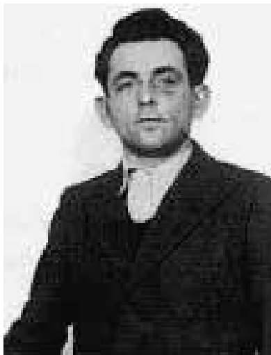
Georg Elser nach seiner Festnahme Nov. 1939.

Elser wurde am 4. Januar 1903 im württembergischen Hermaringen als Sohn eines Landwirts und Holz-