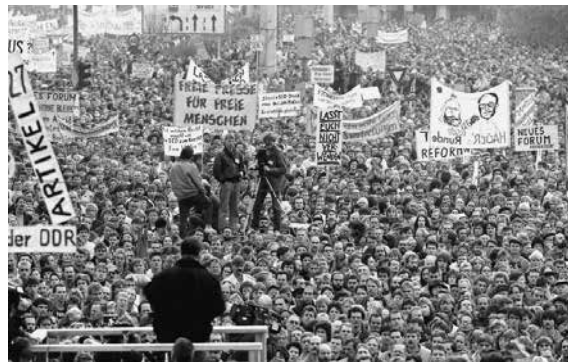
Demonstranten auf dem Alexanderplatz am 4. November 1989.

Während SFB und ZDF die Demonstration filmten, wurden sie von der Hauptabteilung VI (Grenzkontrol-