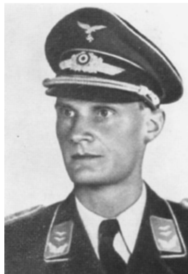
Harro Schulze-Boysen.

Die Organisation um Schulze-Boysen zählt zu den bedeutendsten Widerstandsgruppen gegen den Nationalsozialismus. Mit der Benennung