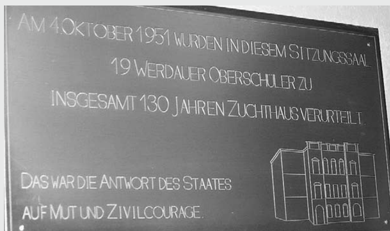
Werdauer Oberschüler, Zwickau, 6. 10. 2008