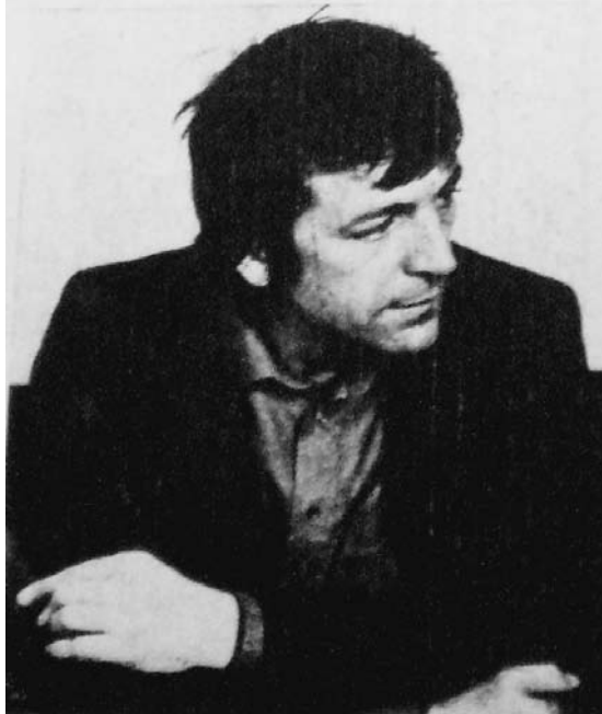
Jorge Semprún 1970

chronologisch erschließen: die frühen Tage des Lesens in der Buchhandlung Nijhoff in Den Haag, die intensive Marx- und Hegellektüre im Kreis gleichgesinnter Pariser Gymnasiasten und Studenten, die den geistigen Boden für den wenig später aufgenommenen Kampf gegen die deutschen Besatzer bereitet. Semprún hat mit diesem Debüt sein