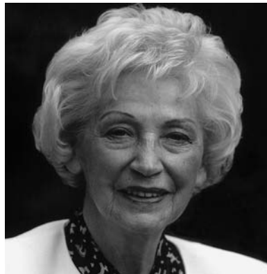
Die Vorsitzende des ZDWV Dr. h.c. Annemarie Renger

Die Auseinandersetzung mit der NS-Vergangenheit ist der Ausgangspunkt der Arbeit des ZDWV. Überlebende Opfer des NS-Terrors und ihre Nachfahren prägen bis heute unsere Tradition, die auch ganz junge Leute anzieht. Nach und nach kamen immer mehr Opfer der SED-Diktatur und Überlebende des Gulag dazu, weil sie sich in unserer Tradition gut aufgehoben sehen. So konnte ich bereits vor vier Jahren hier am gleichen Platz feststellen: „In unseren Reihen – in den Reihen des Zentralverbandes Demokratischer Widerstandskämpfer- und Verfolgtenorganisationen – sitzen